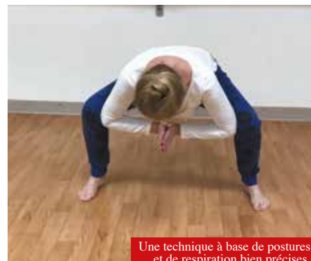
Une technique à base de postures et de respiration bien précises.