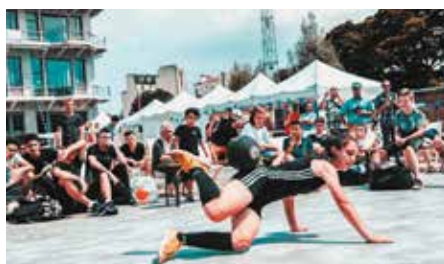
Classée dans le top 10 lors du Championnat de France freestyle 2018.

À découvrir sur ses vidéos Instagram où elle est déjà suivie par 22 000 abonnés, mais aussi sur le site wiz.freestyle .