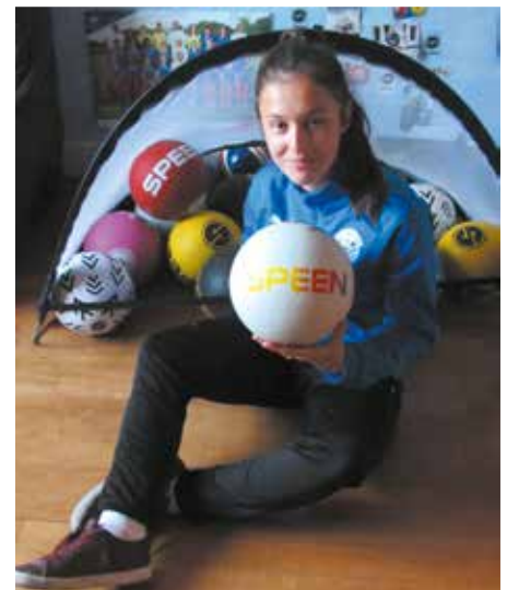
Des heures d'entraînement dans sa chambre d'ado.