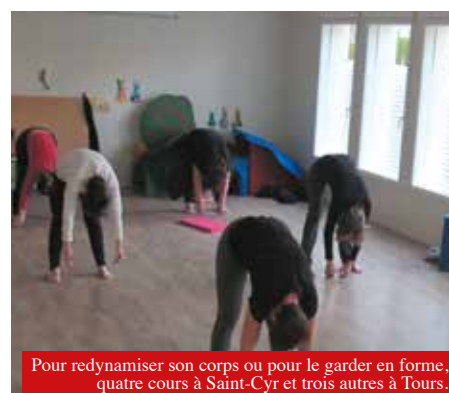
Pour redynamiser son corps ou pour le garder en forme, quatre cours à Saint-Cyr et trois autres à Tours.