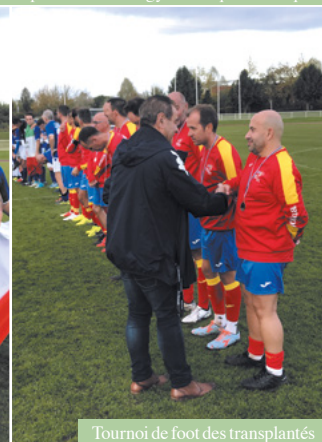
Tournoi de foot des transplantés