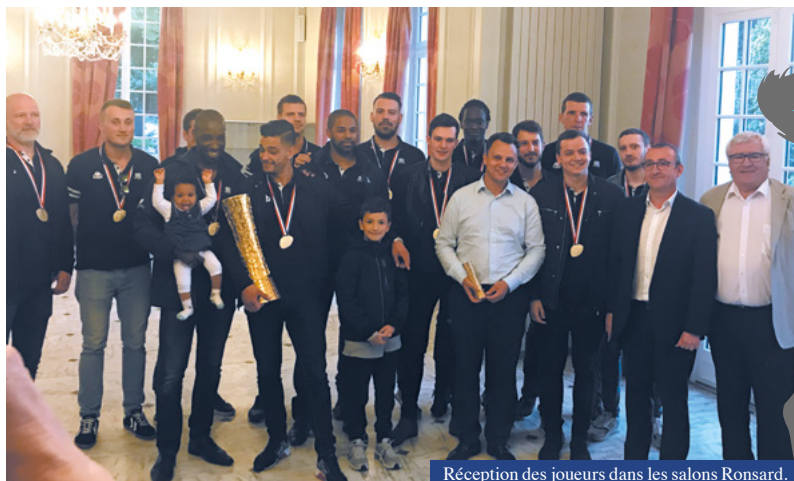
Réception des joueurs dans les salons Ronsard.