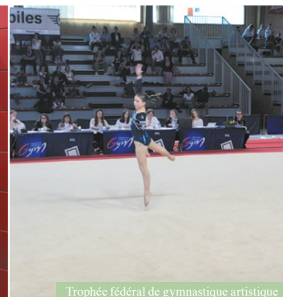
Trophée fédéral de gymnastique artistique