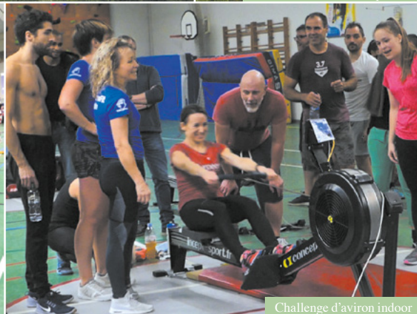
Challenge d'aviron indoor