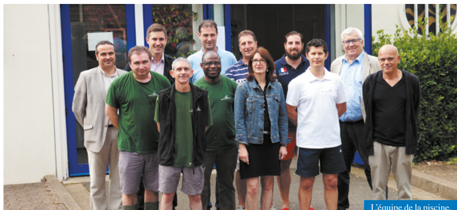
L'équipe de la piscine.

Piscine municipale Ernest Watel Rue de la Mairie - 0247428081 piscine.e.watel@saint-cyr-sur-loire.com