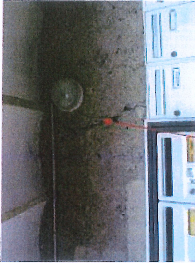
11 12 QUAI PORTILION CHANAGE A CONSOLIDER LEZARDE A SURVEILLER (POSE DE TEMOINS)