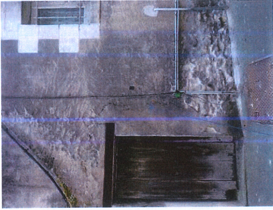
4 RUE TONNELLE LEZARDE A SURVEILLER (POSE DE TEMOINS)